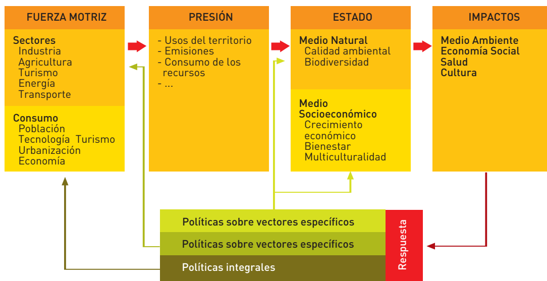
FIGURA I. Esquema analítico y operativo del proceso de elaboración del Informe Sostenibilidad en España 2011.

Los indicadores se convierten en el factor esencial para la evaluación y análisis de la sostenibilidad, erigiéndose como las herramientas útiles y versátiles con las que se debe contar para que, mediante su análisis continuado podamos obtener conclusiones y puntos de referencia a fin de repensar las políticas implantadas y definir otras nuevas y más eficaces que permitan el progreso de las sociedades con mayor eficiencia, equidad y responsabilidad.